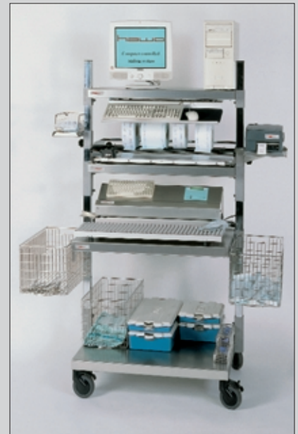
hm 2010 WST

Sterilgutverpackung Sterile goods packaging Conditionnement de produits stériles