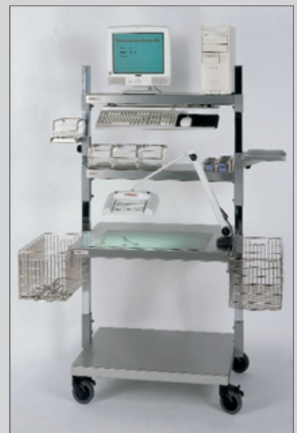
hm 2010 WST

Sterilgutverpackung Sterile goods packaging Conditionnement de produits stériles