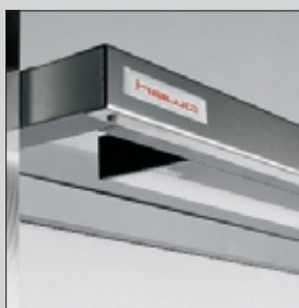
Indirekte Beleuchtung Indirect lights Illumination indirecte

Qualitätssicherung Sterile quality assurance L'assurance de qualité